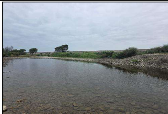
Punto inicial del tramo crítico se observa que el caudal ha llevado parte del dique marguen derecha del río, al fondo existen áreas de cultivo.