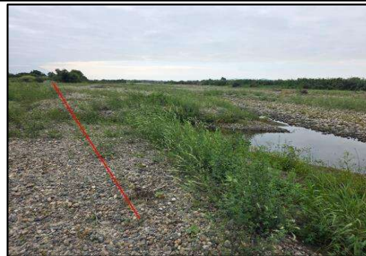
Punto final del tramo crítico la línea roja muestra la ubicación donde se realizaria la conformación del dique con material propio del río.